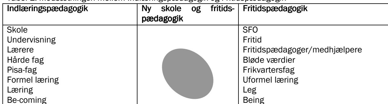
Tabel 1: Modsætningen mellem Indlæringspædagogik og Fritidspædagogik